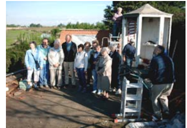
Besuch aus der Pfarrei